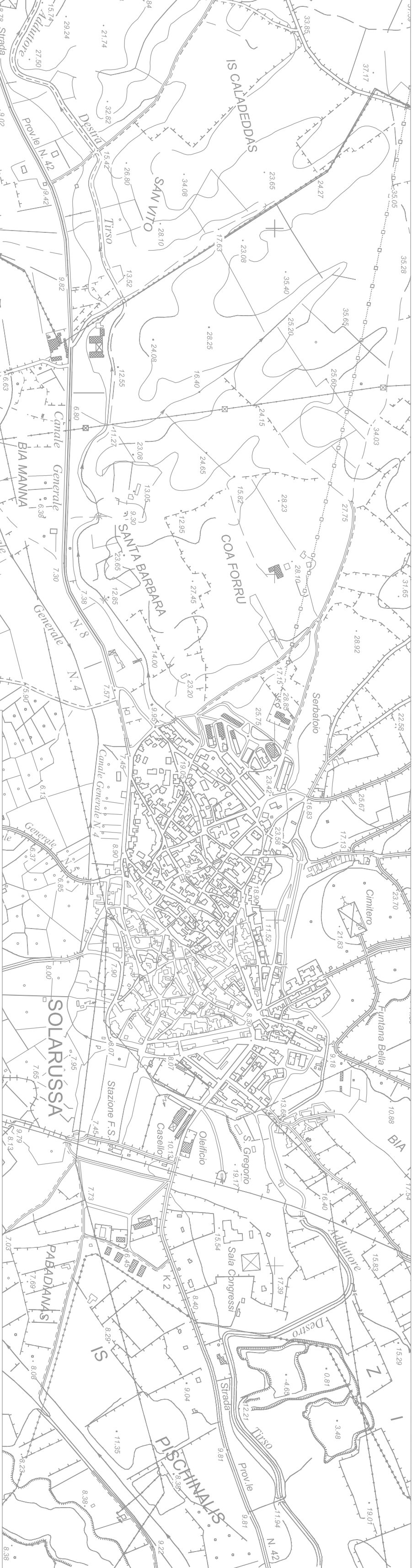
CENTRO URBANO Scala 1:2000